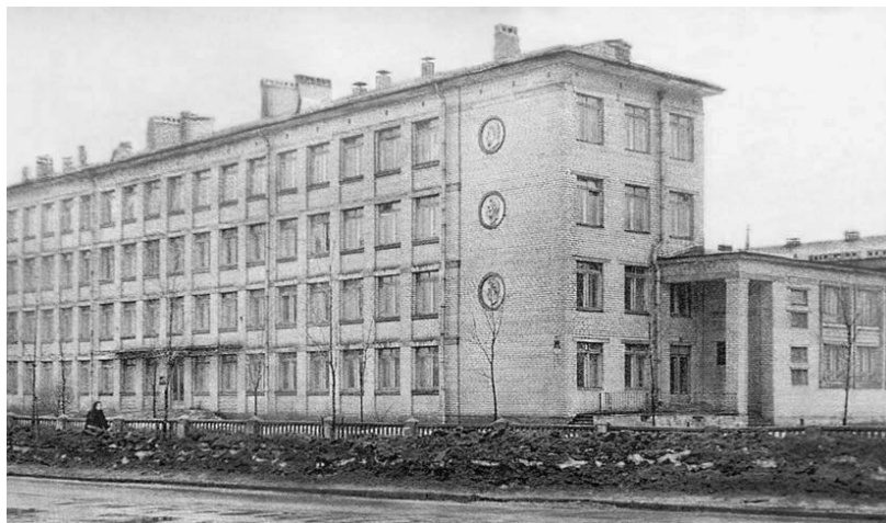
Интернат № 45 при ЛГУ

автору на вопросы, связанные с сегодняшней жизнью интерната, и рассказавших о текущих планах его развития.