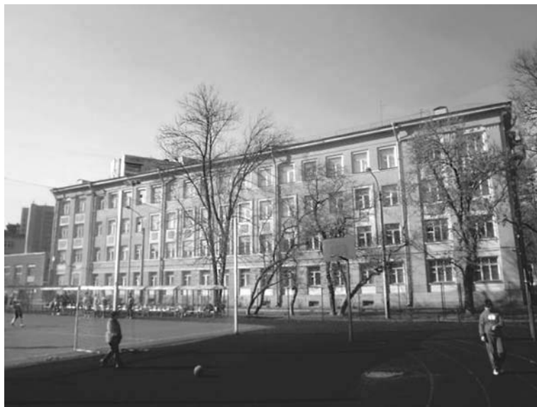
Гимназия имени Д. К. Фаддеева (современный вид)

рожелательной атмосфере товарищества и взаимопомощи, под руководством выдающихся педагогов, вспоминались впоследствии, по признанию многих выпускников, как время подлинного счастья.