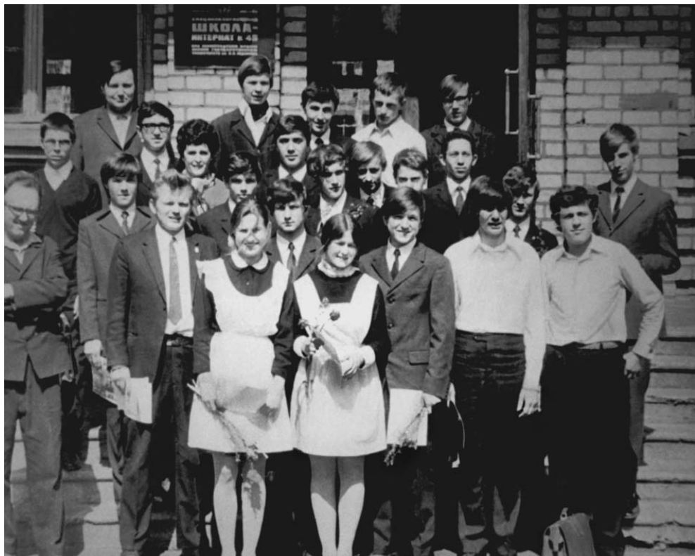
Выпускники 1972 года

в качестве E множество натуральных чисел, а в качестве «промежутков» рассматривать любые (в том числе и неограниченные) его подмножества, состоящие из натуральных чисел, идущих подряд. При этом длина конечного промежутка по определению полагается равной нулю, а бесконечно-го единице. Тогда ограниченная функция на E — это произвольная ограниченная числовая последовательность чисел, а её интегрируемость эквивалентна существованию у неё предела, понимаемого в обычном смысле. Итак, классическое понятие предела последовательности можно рассматривать как частный случай приведённого выше понятия интеграла.