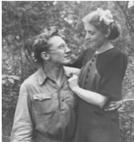
А. А. Киселёв и О. А. Ладъженская, 1947 год

В 1947 году Ольга вышла замуж за ленинградского математика Андрея Алексеевича Киселёва 26) (1916–1994) и переехала в Ленинград, где по рекомендации из МГУ поступила в аспирантуру ЛГУ под руководством С. Л. Соболева 27) .