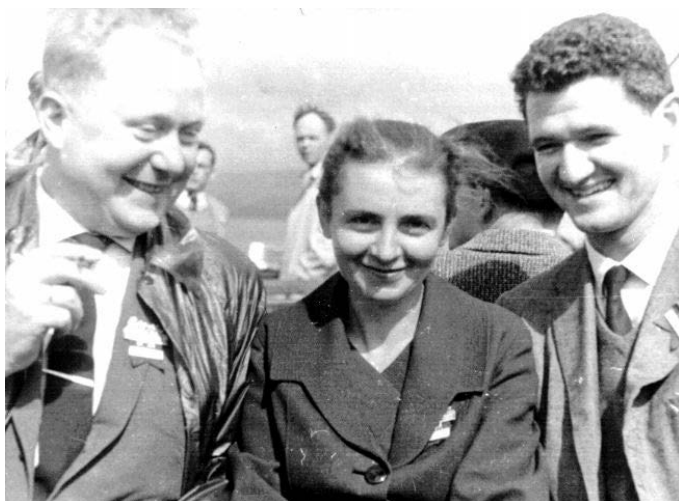
ИСМ1958, Эдинбург. Х. О. Кордес 41) , О. А. Ладыженская, П. Лакс 42)

В 1963 году вышел перевод этой книги на английский язык, а в 1970 году — второе русское издание, существенно дополненное и переработанное. Позднее монография была переведена ещё на несколько языков и стала «библией» для всех специалистов по математической гидродинамике.