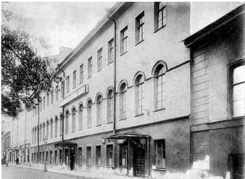
Ларинская Санкт-Петербургская гимназия (Шестая линия Васильевского острова, д. 15)