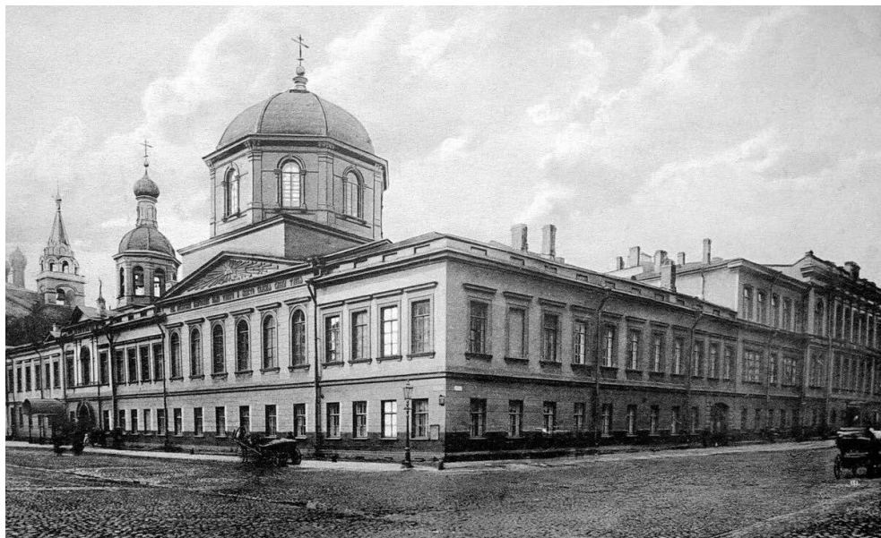
Первая Санкт-Петербургская гимназия (Ивановская улица, д. 7)

корпуса инженеров путей сообщения, Главном педагогическом институте и Главном инженерном училище.