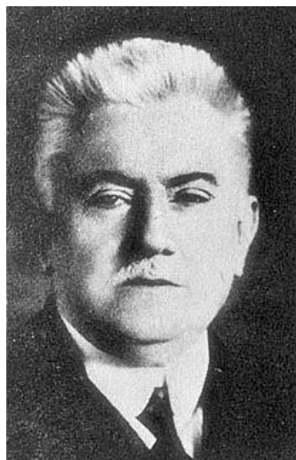
Йозеф Кюршак (1864–1933)