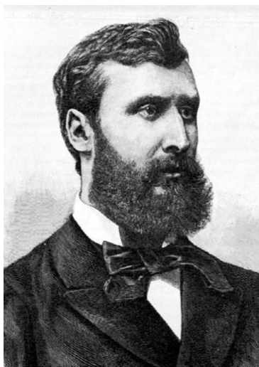
Лоран Этвёш (1848–1919)