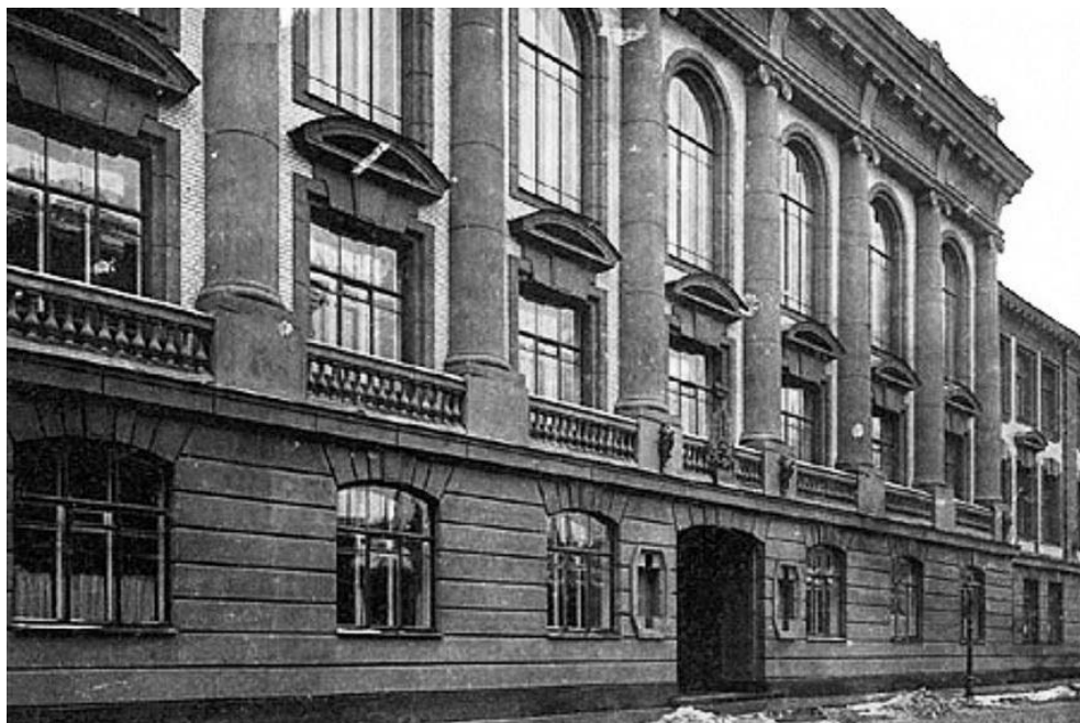
Вторая Санкт-Петербургская гимназия (Казанская улица, д. 27)

образом, скажем, средний возраст участников олимпиады по алгебре (учеников четвёртых классов Санкт-Петербургских гимназий) равнялся примерно 14 годам, что соответствует нынешнему восьмому или девятому классу российской средней школы.