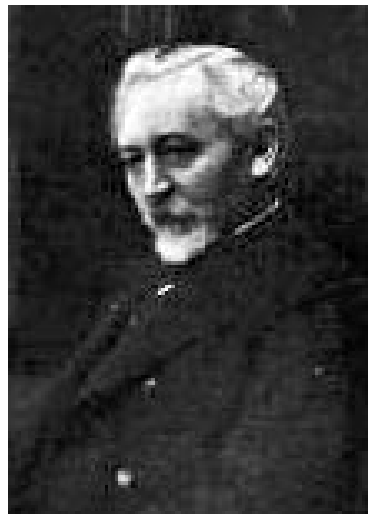
Э. К. Шпачинский (1848–1912)

ежегодных конкурсов по астрономии для «учащейся молодёжи». В двух статьях приводилась ссылка на книгу [9], но в ней не удалось обнаружить какого-либо упоминания об олимпиадах или конкурсах. Заинтересовавшись этим любопытным вопросом, я обратился к знакомым астрономам, непосредственно вовлечённым в школьные астрономические олимпиады.