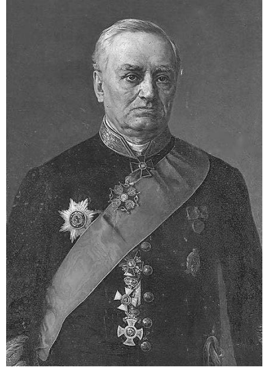
И. И. Глазунов (1826–1889)

Итак, подведём итоги. Более 180 лет назад Санкт-Петербургский «отдел народного образования» вместе с профессорами столичного университета на протяжении трёх лет проводил городскую олимпиаду по четырём предметам школьной программы (в очном письменном формате). Совершенно очевидно, что имелось