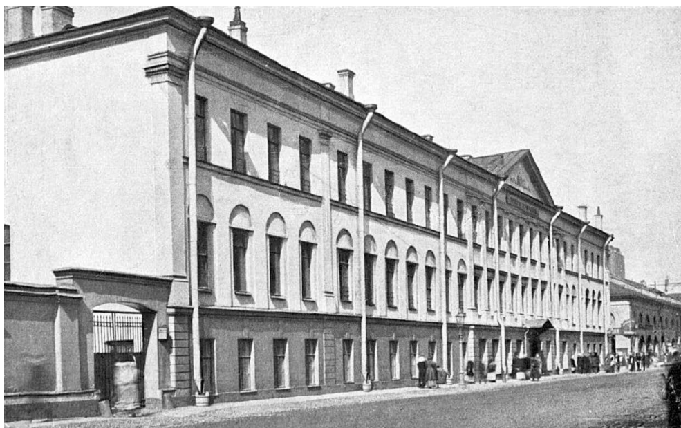
Третья Санкт-Петербургская гимназия (Гагаринская улица, д. 23)

Шансов поступить в одну из этих гимназий у сына прачки, извозчика, заводского рабочего или крестьянина было крайне мало.