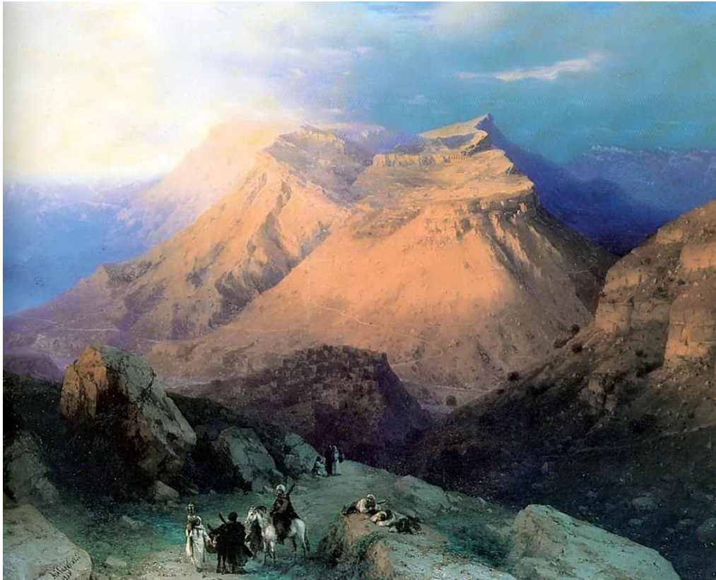
Айвазовский. Аул Гуниб в Дагестане