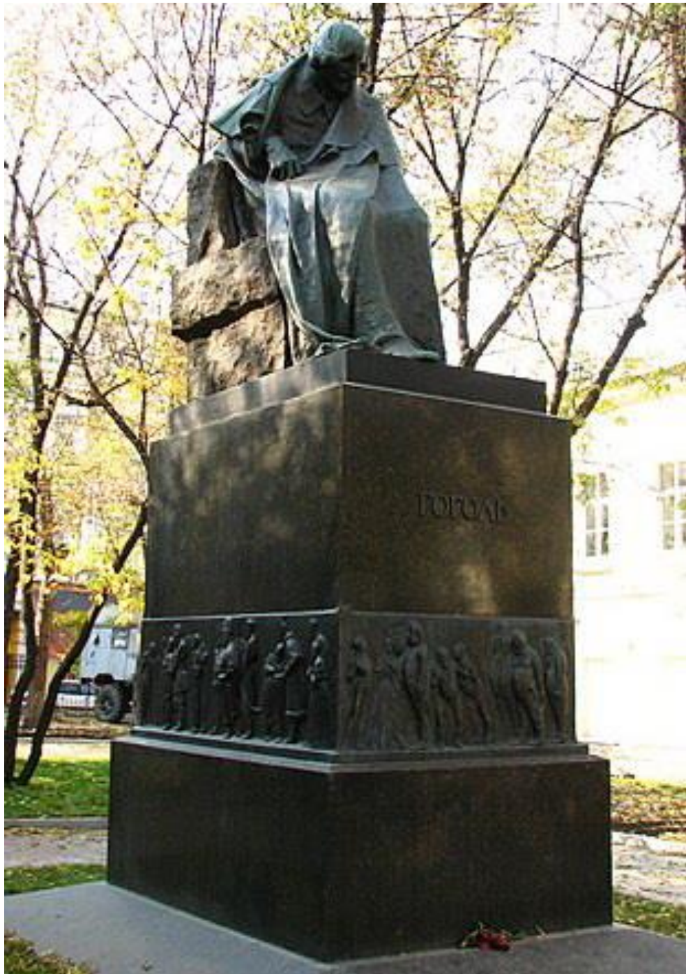
Памятник Гоголю на Никитском бульваре в Москве