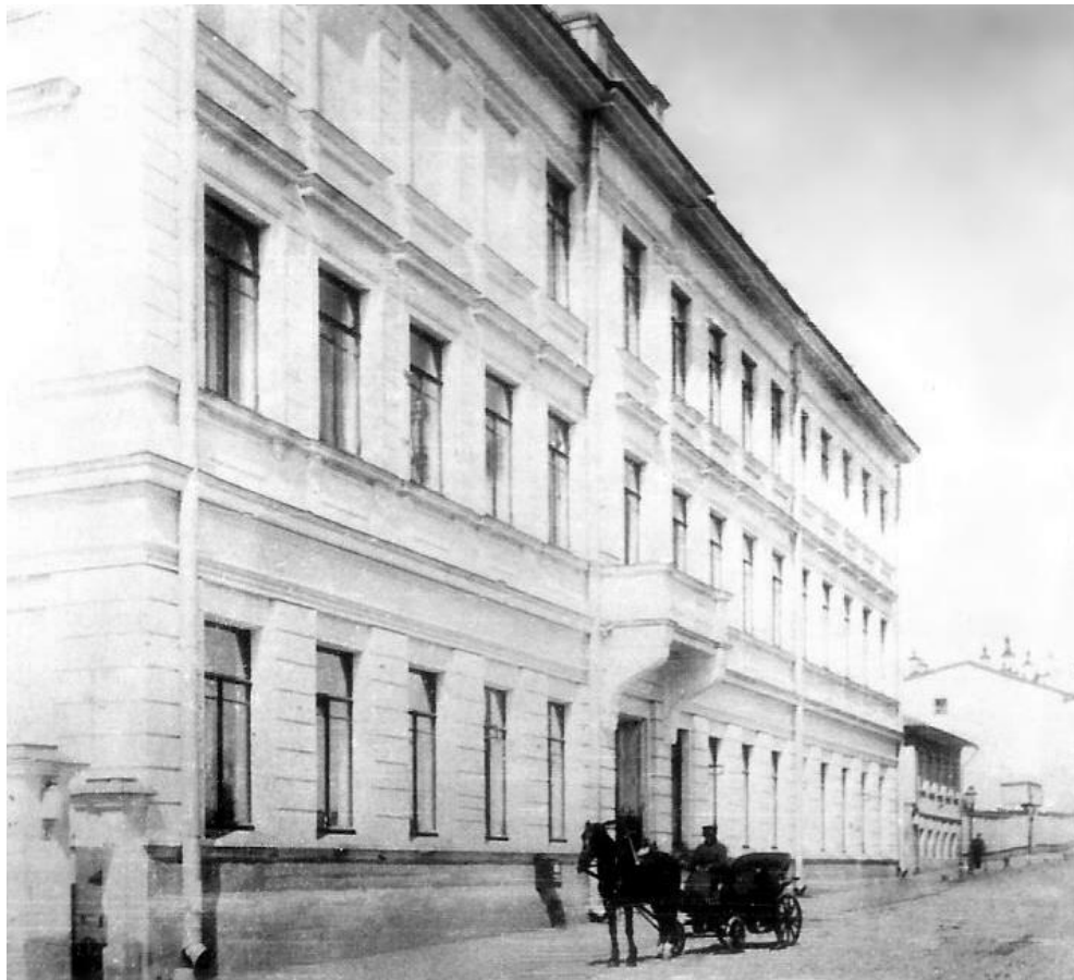
Москва. Реальное училище Мазинга, ныне Школа № 57