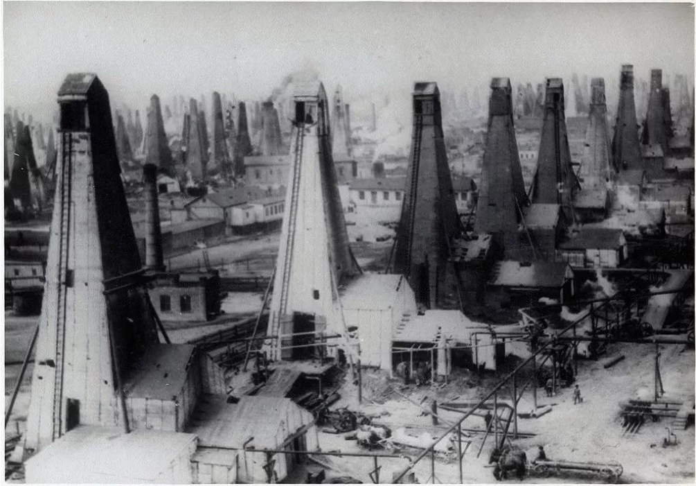
Баку начала XX века. Вышки Нобеля