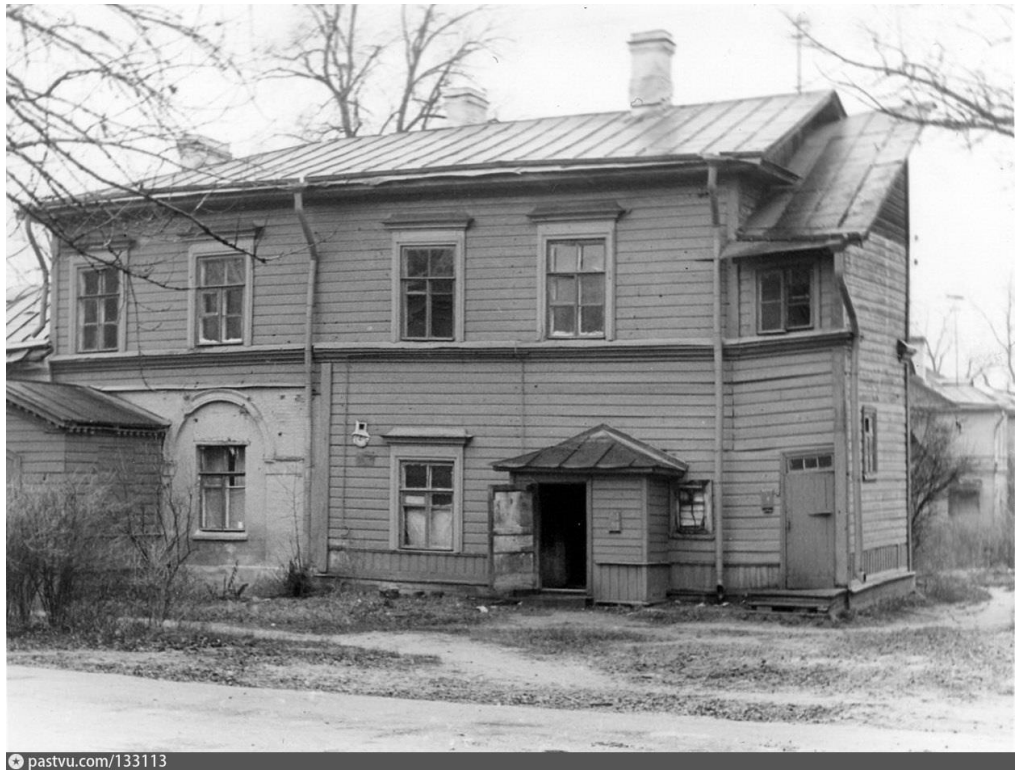
Павловск, ул. Просвещения, д. 2 (бывшая Под Липками)