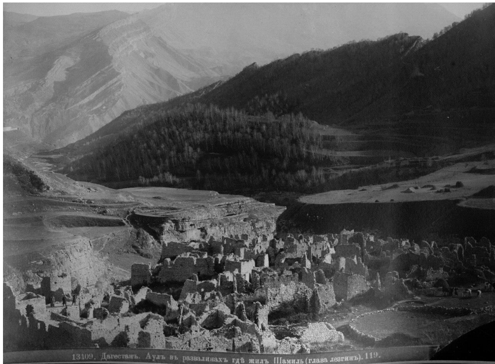
13109. Дагестанъ. Ауль въ развалинахъ гдѣ жилъ Шамиль (глава дегинъ). 119.